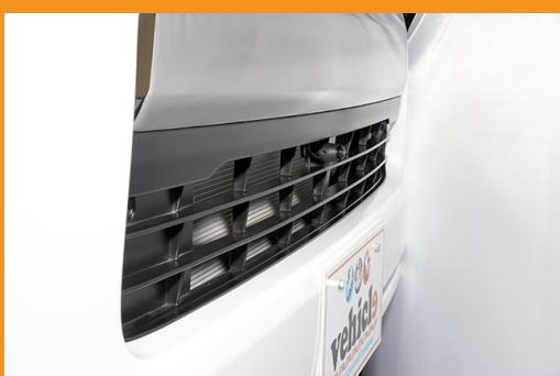
・フロントサイドカメラ装着