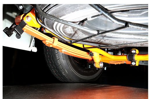
⑤ A-1 オプティマリーフ装着時