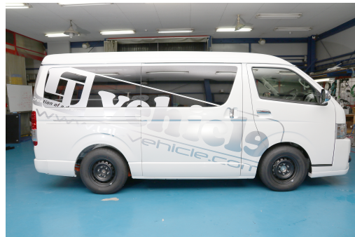
③ サイド (右)