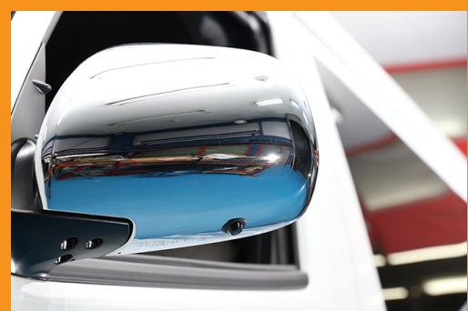
・サイドカメラ装着