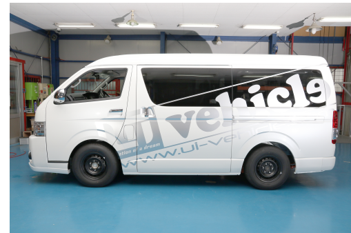
④ サイド (左)